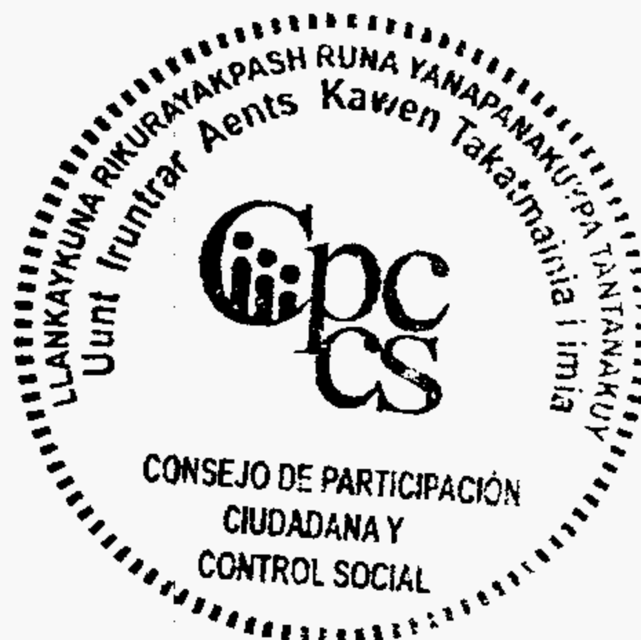
Firma Responsable CPCCS