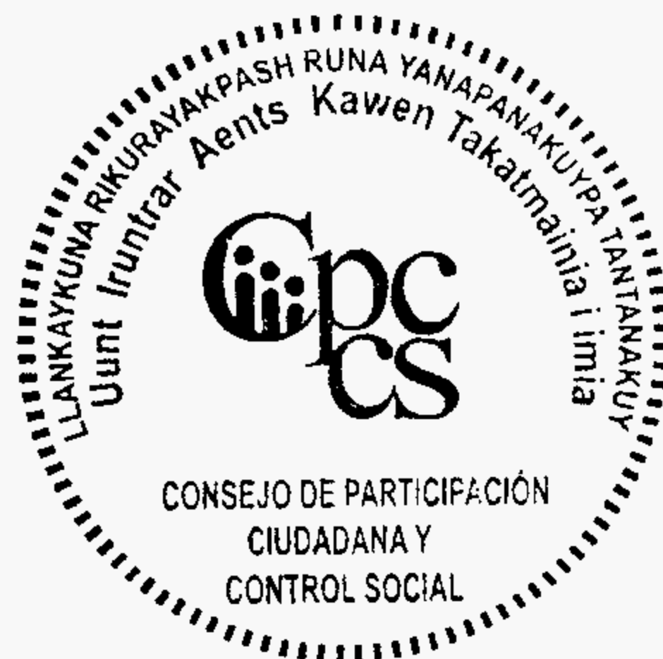
Firma Responsable CPCCS

Handwritten signature of the responsible person for CPCS.