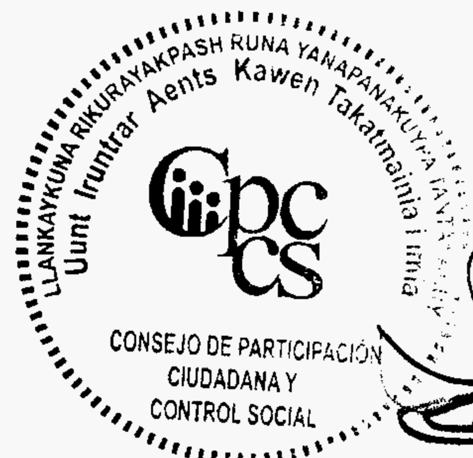
Firma Responsable CPCCS

Handwritten signature of the responsible person.