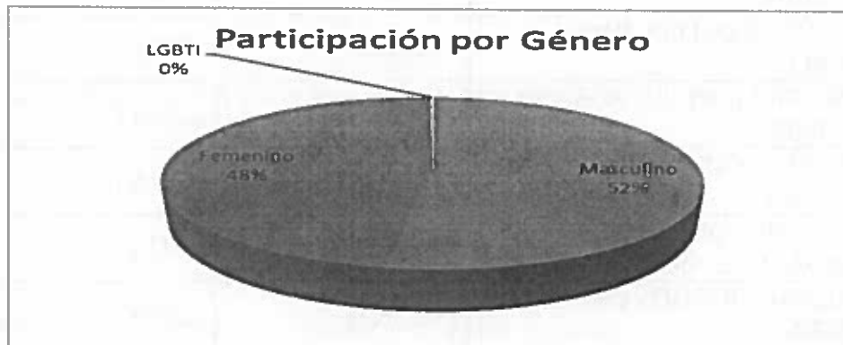
Gráfico No. 2