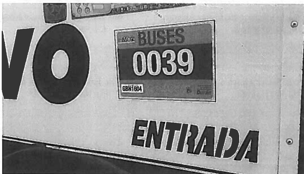
Foto No.3. Sticker aplicado en la parte lateral del bus, junto a la puerta de acceso.