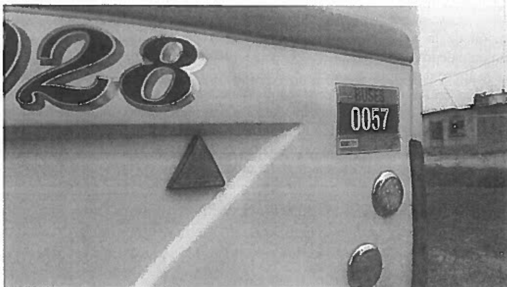
Foto No.2. Sticker aplicado en la parte posterior del bus, luego de haber aprobado la revisión.