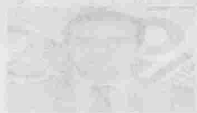
FIGURE 1. Laryngeal collapse in a horse.

... of the larynx, which is the voice box, is a common condition in horses. It is characterized by a harsh, raspy sound when the horse breathes, especially during exercise.