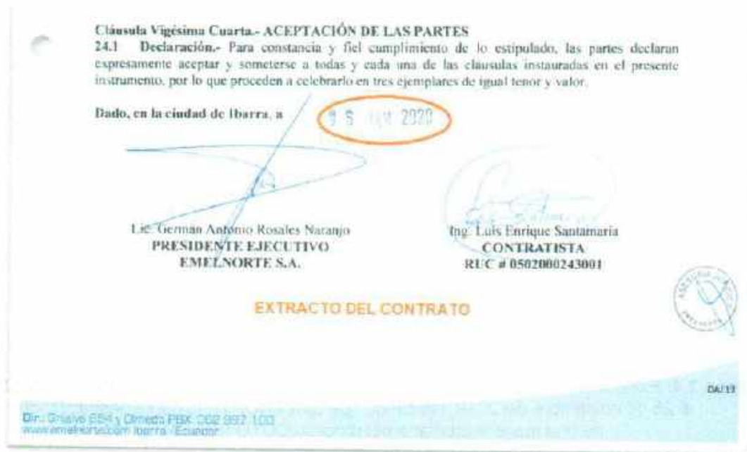
Imagen 2.3. Extracto del contrato que se encuentra en el portal del SERCOP, nótese que en este proceso de contratación EMELNORTE suscribe el contrato con una persona natural, a pesar de que quien gana la oferta fue el CONSORCIO ELECTRICO QUICHINCHE

Normalmente en cualquier entidad pública en la que como proveedores del estado un oferente haya salido favorecido con la adjudicación del proceso de contratación, siempre se firma primeramente el contrato, toda vez que se haya cumplido con todos los requerimientos solicitados por la entidad contratante, para posteriormente hacer el desembolso del anticipo. No es comprensible entender, como la empresa EMELNORTE lleva este procedimiento de esta forma tan "singular"; esto hace presumir que existe mucho afán por entregar el dinero del anticipo de los diferentes procesos; razón por la que, se debería revisar más a fondo todos los procesos de contratación que esta empresa los tiene en estado adjudicados.