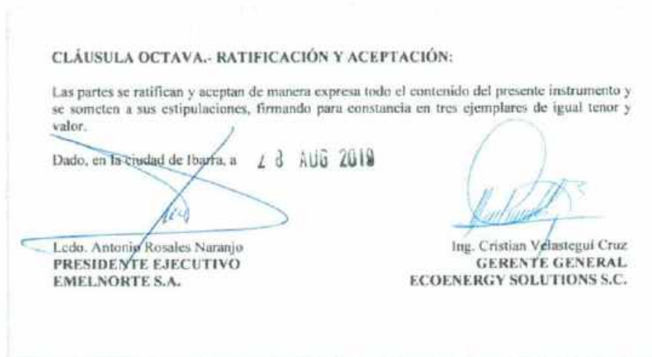
Imagen 5.11: Extracto del CONTRATO DE TERMINACIÓN POR MUTUO ACUERDO, donde se suscriben la CONTRATANTE y la CONTRATISTA

El CONTRATO DE TERMINACIÓN POR MUTUO ACUERDO fue firmado el 28 de agosto del 2019, ocho (8) días después de haber firmado el contrato, mismo que se suscribió el 20 de agosto del 2019.